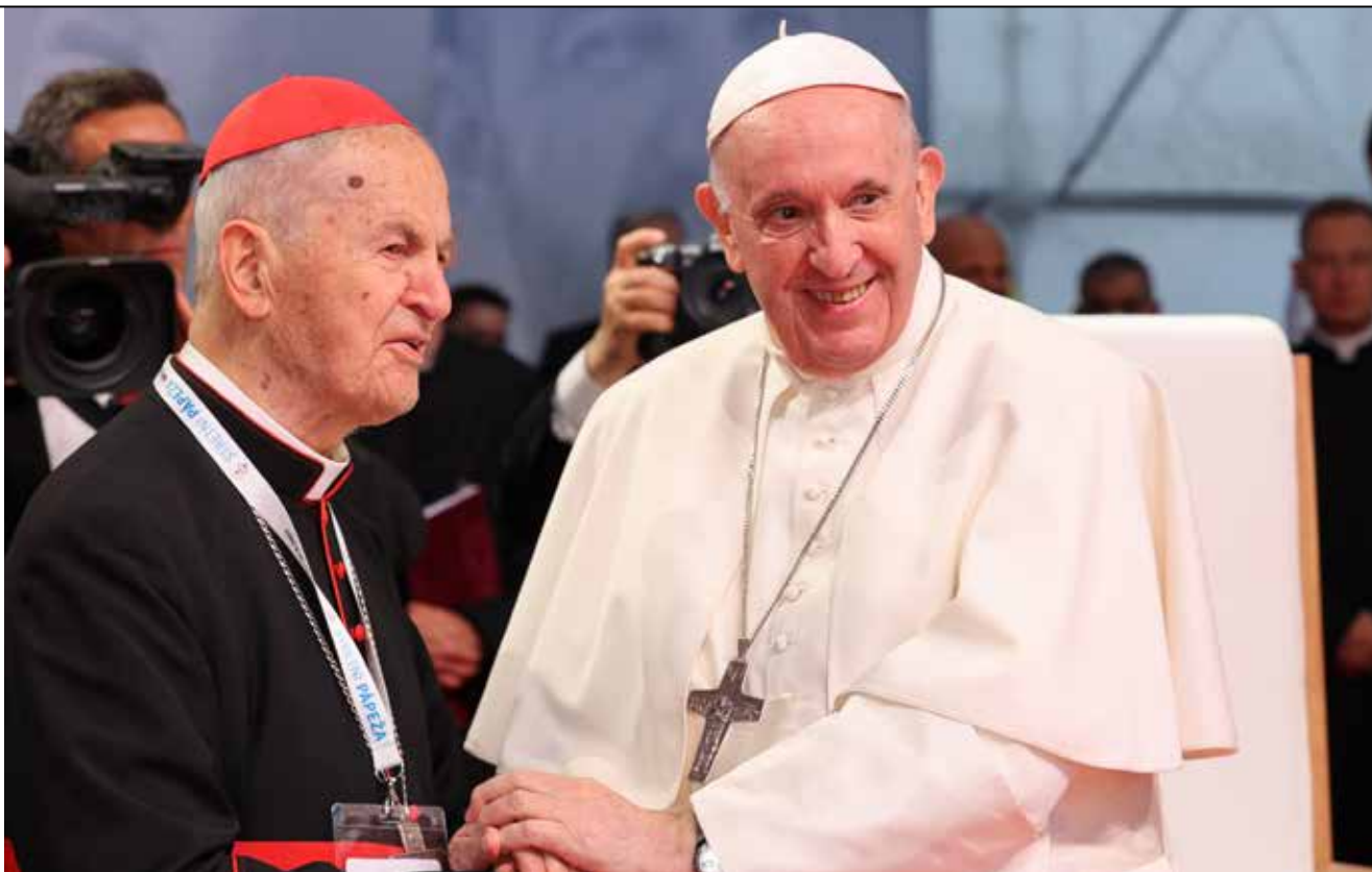
Svätý Otec František a kardinál Jozef Tomko na stretnutí s mladými na Štadióne Lokomotíva v Košiciach 14. septembra 2021

K Vianociam by sme sa nemali utiekať ako k bájke, povesti alebo ako k niečomu materiálnemu.