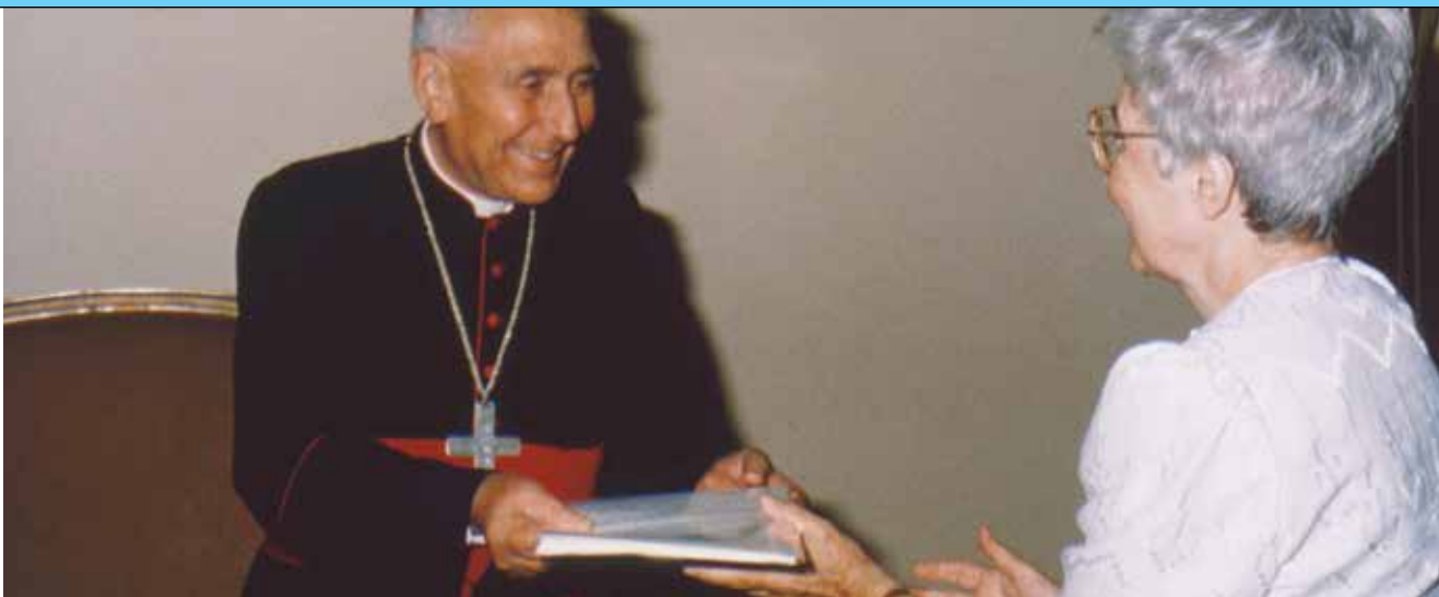
1990: Chiara Lubichová dostáva z rúk kardinála Eduarda Pironia Základné stanovy Máriinho diela.