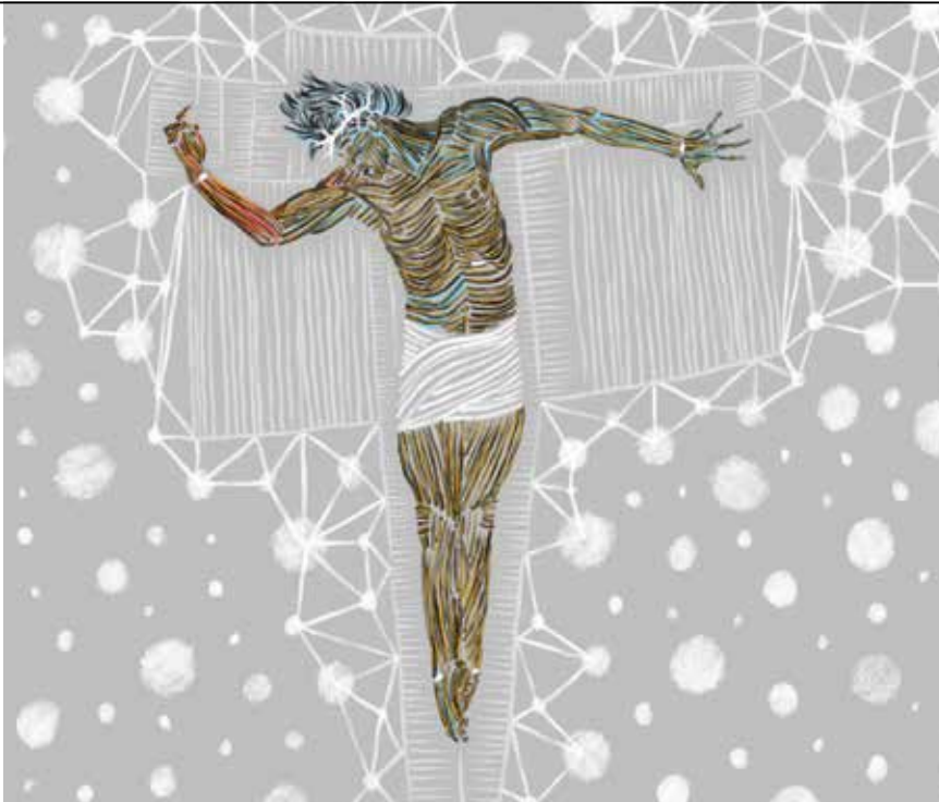
Null and void, 2017

Dôležité tiež je, že s týmito ľuďmi mám vzťah, vďaka ktorému si moje obrazy ľahšie všimnú.