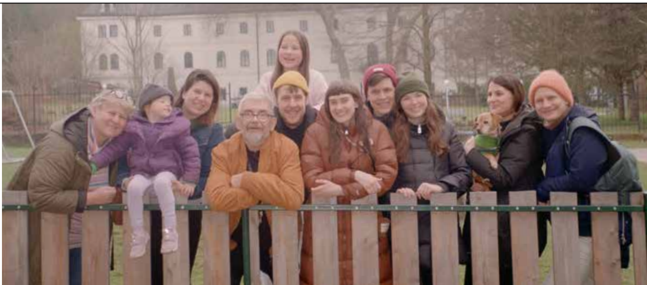
Stano v kruhu svojich najbližších. Určite povedal nejaký vtip, lebo všetci sa krásne usmievajú.

ocinko: stávaš sa našim otcom nebeským. Moje oči a myseľ ťa hľadajú všade. Za horizontom, nad oblakmi či v šumení mora, alebo vo vánku vetra. No existuje jedno miesto, kde ťa nájdem vždy a kde si nastálo: v mojom srdci.