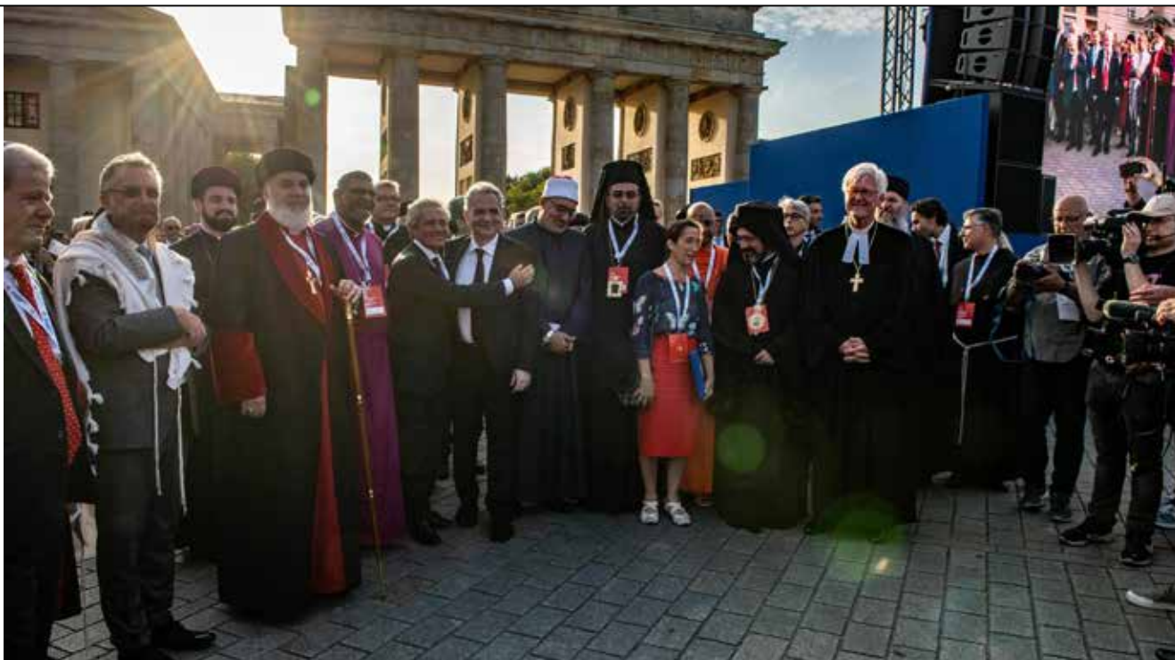
Záverečný ceremoniál pri Brandenburskej bráne za účasti významných náboženských predstaviteľov.

moskovského patriarchu Kirilla nemecký prezident. Pravoslávni zástupcovia z Ruska neboli na mierovú konferenciu pozvaní.