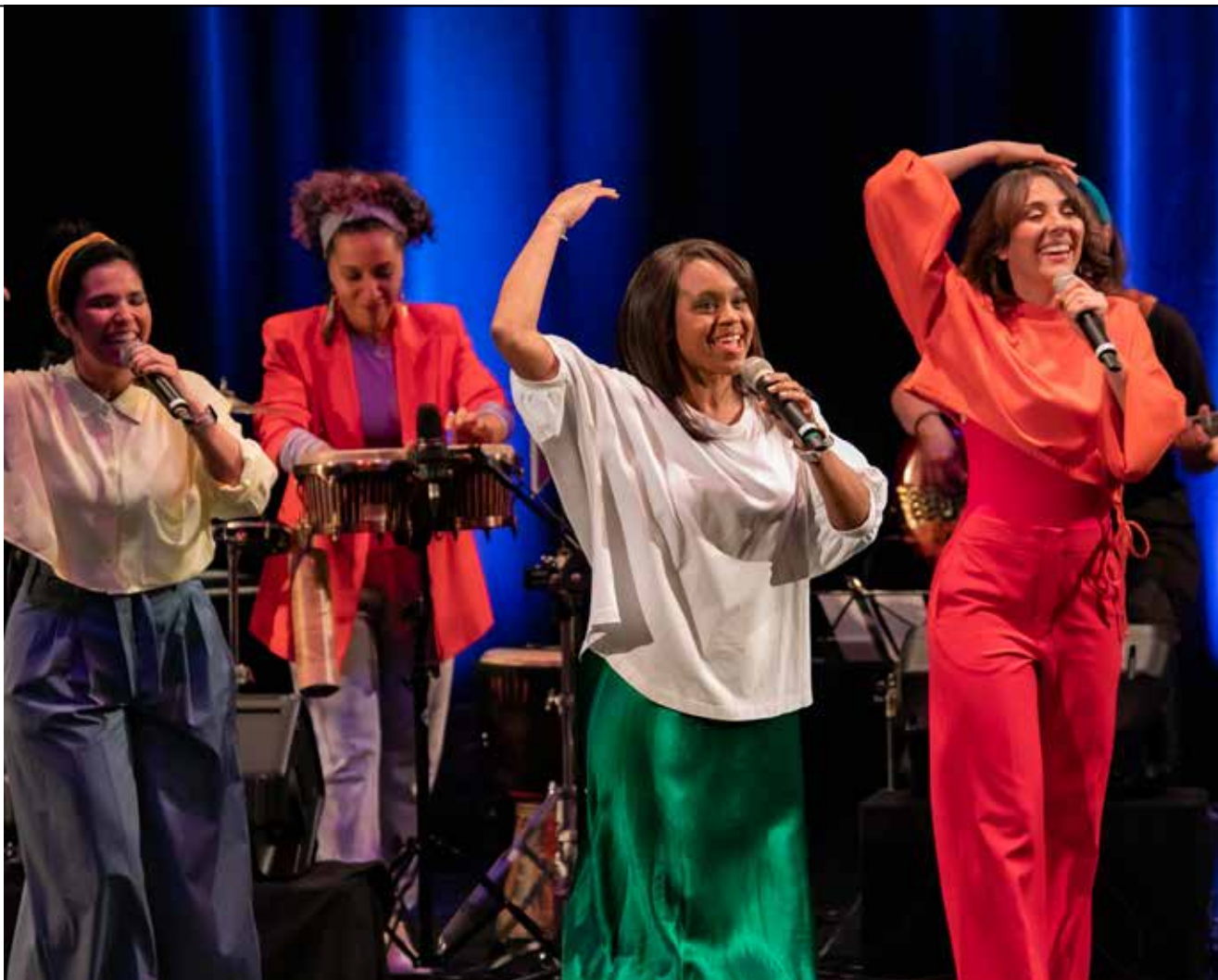
Koncert Gen Verde v Bratislave

ňa spoločnosť a chce zaplaviť svetlom tých, ktorí sú predom mnou. Chcela by som svoj život venovať tomu, aby som ľuďom vrátila radosť, nádej.