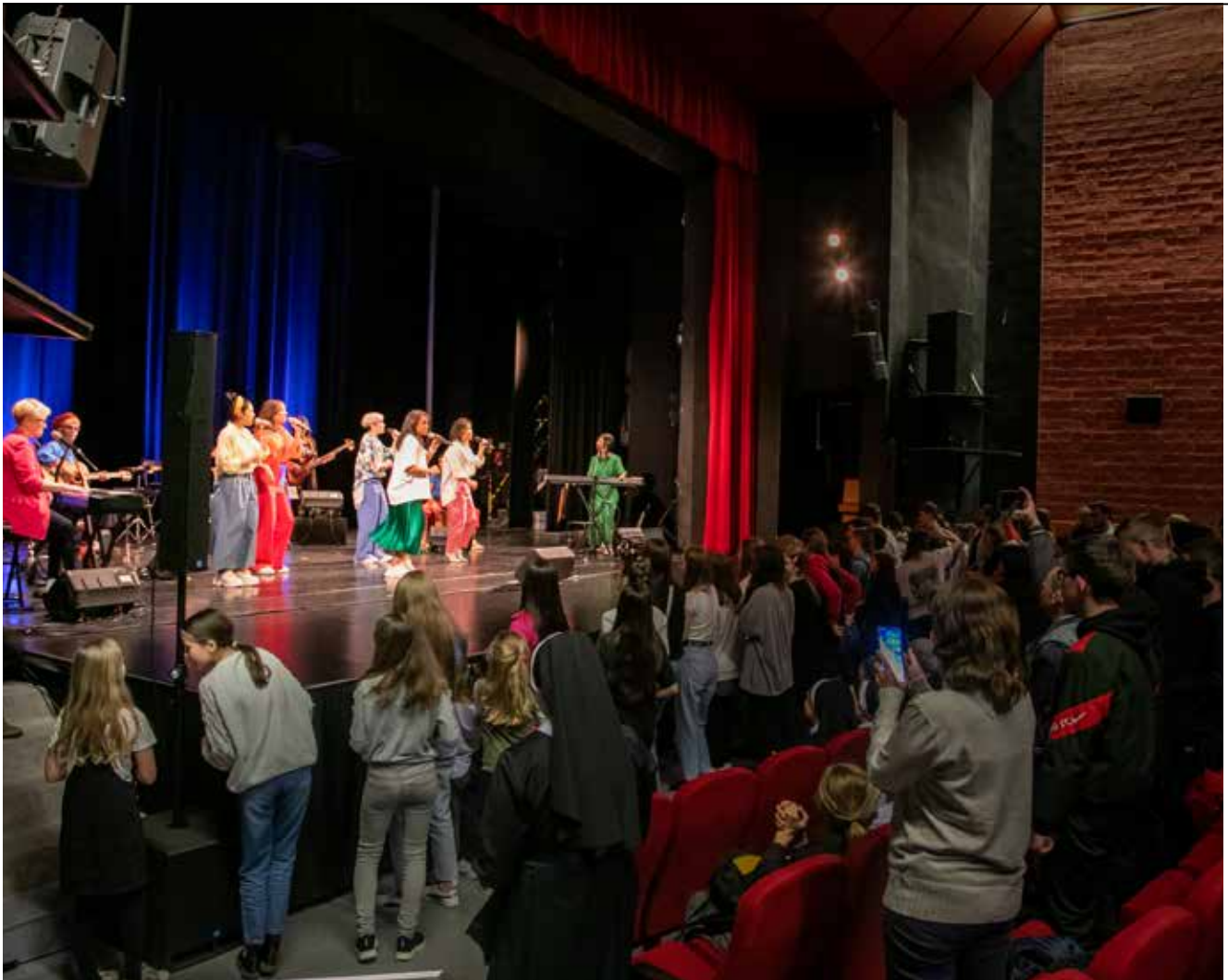
Koncert Gen Verde v Bratislave

niektorých z nás, alebo skúsenosťami ľudí so silnými hodnotami. Prežívame situácie mladých ľudí, snažíme sa preniknúť do ich jazyka. Naša ponuka obsahuje tak svetské piesne, ako aj liturgický repertoár.