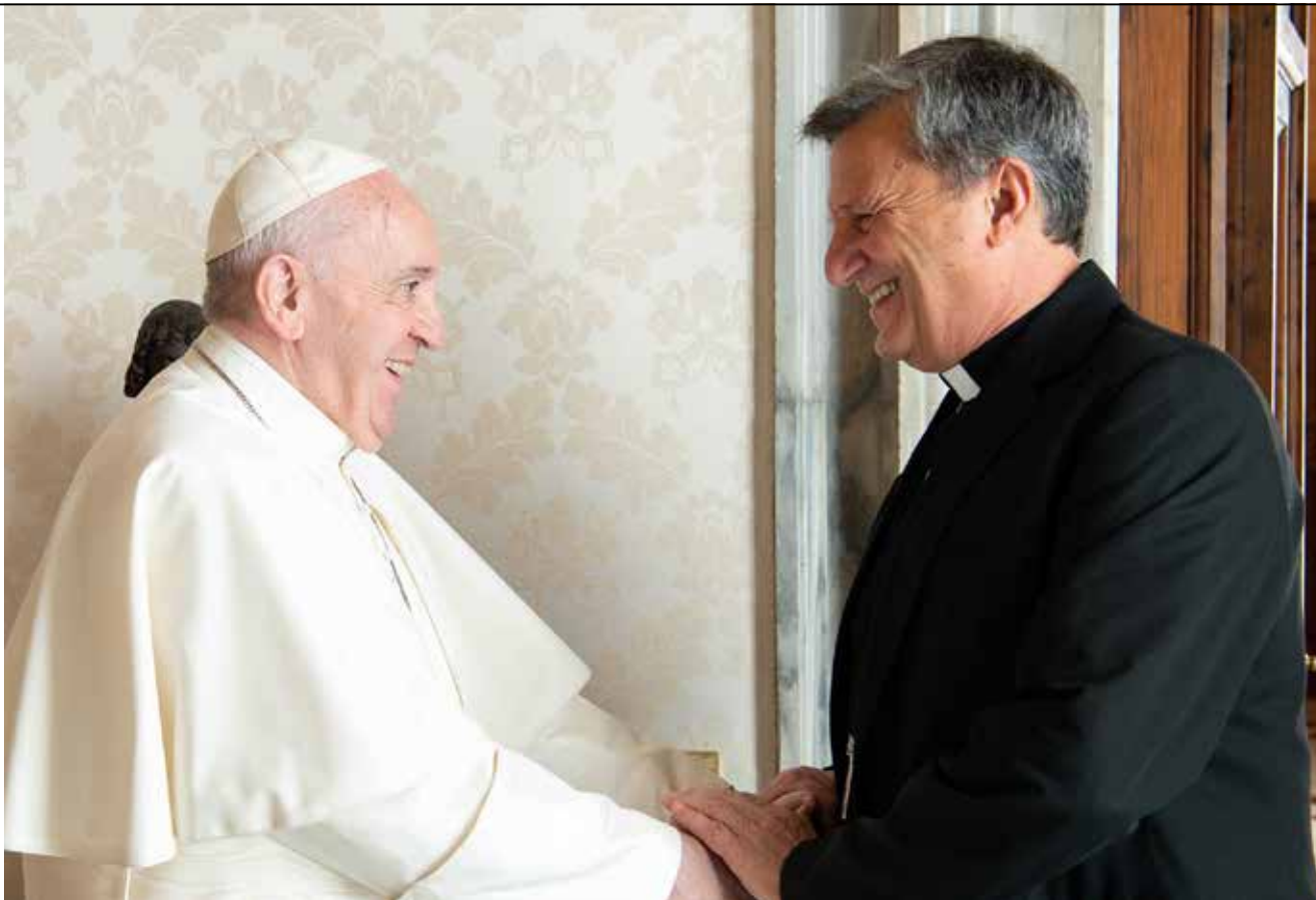
Svätý Otec František sa srdečne zdraví s generálnym sekretárom Synody biskupov a bývalým predsedom konferencie biskupov Malty, kardinálom Mariom Grechom.

Cirkvi, z ktorej sa nikto necíti vylúčený. Prijatie neznamená schvaľovať rozhodnutia jednotlivých osôb, ale je to spoločné kráčanie, aj keď sme odlišní. Je to tak preto, lebo sme presvedčení, že priblížením sa k iným, kráčaním s inými, dokonca aj s tými, ktorí sú odlišní, nie sme sami, ale je tu Duch Svätý. A cez našu prítomnosť, cez naše prijatie, blízkosť, solidaritu Duch prechádza aj na iných.