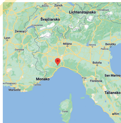
Sassello, Chiarino rodisko