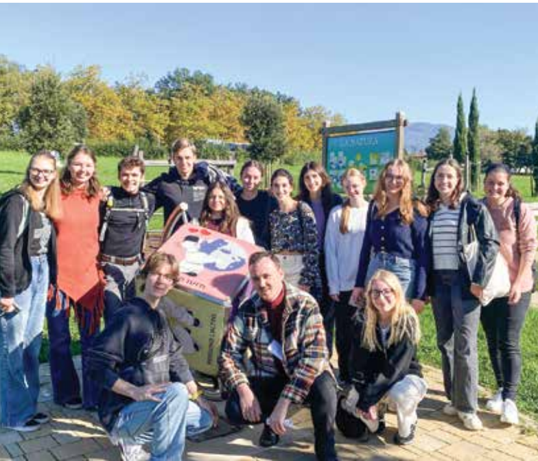
Časť mladých zo Slovenska a Čiech na Mission possible v Loppiane